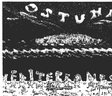
Settimana dei bambini del Mediterraneo FESTA Bambini del Mediterraneo

Porteranno le loro testimonianze anche un educatore del Marocco, quella di un giovane egiziano che opera con i Padri Comboniani e che fa l'educatore in una comunità di ben cinquemila ragazzi; un gruppo multi-etnico di Genova con giovani originari dal Perù, dal Messico, dal Marocco mentre sarà presente una delegazione di ragazzi albanesi.