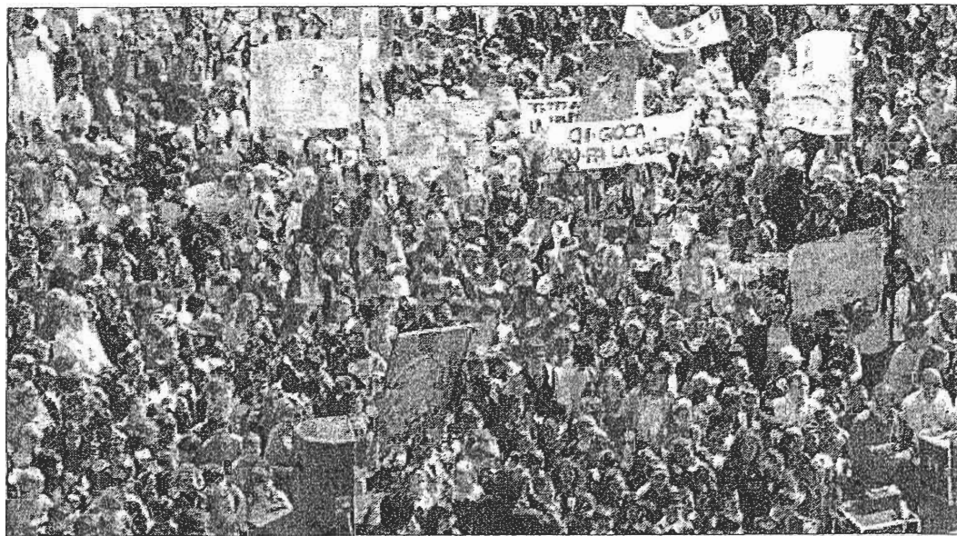
Una delle passate edizioni