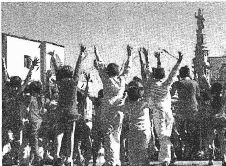
Una delle precedenti edizioni della manifestazione

ha detto l'assessore - uno strumento essenziale per superare le difficoltà che ci sono e per garantire la buona riuscita della Settimana. Quel che ci piace oggi è vedere la scuola che si apre a quest'esperienza: le vicende che hanno attraversato il Nord Africa sono un forte segnale di cambiamento, ma portano con loro anche tanta sofferenza. Allora la Settimana vuole avvicinarci e ispirarci ad una cultura