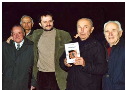
Grafico e autore di manifesti e storie illustrate, nel 2007, con le sue particolarissime "illustrazioni di carta", ha ricevuto il Premio speciale per la sperimentazione iconica e la ricerca espressiva al Premio internazionale di illustrazione Stepan Zavrel .

Nei suoi racconti i giovani protagonisti si trovano spesso di fronte a scelte fondamentali e vivono vicende che fanno sorridere e commuovere e danno al lettore un'occasione in più per riflettere su argomenti e problematiche legate alla storia recente e all'attualità.